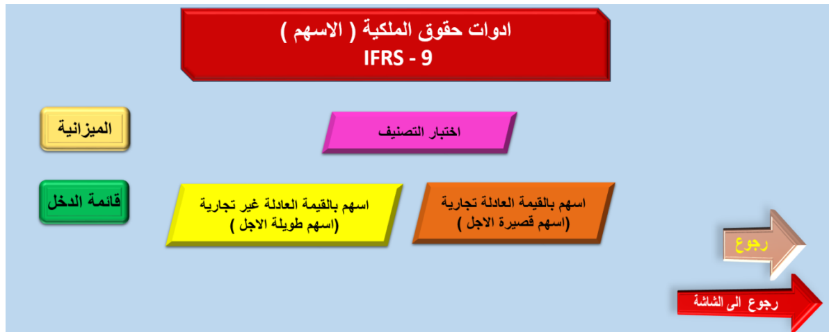
الشكل رقم (٤) نافذة ادوات حقوق الملكية (الاسهم)

من خلال النافذة اعلاه نلاحظ وجود ثلاث انواع من الاصول وهي ( الممتلكات والالات والمعدات ، الاستثمارات العقارية ، الاصول المالية ) بالاضافة الى مداخل القياس المحاسبي وقائمة الميزانية وقائمة الدخل الشاملة .