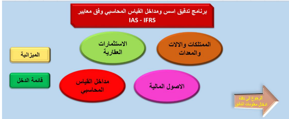
الشكل رقم (٣) النافذة الرئيسية للبرنامج

من خلال النافذة اعلاه نلاحظ وجود ثلاث انواع من الاصول وهي ( الممتلكات والالات والمعدات ، الاستثمارات العقارية ، الاصول المالية ) بالاضافة الى مداخل القياس المحاسبي وقائمة الميزانية وقائمة الدخل الشاملة .