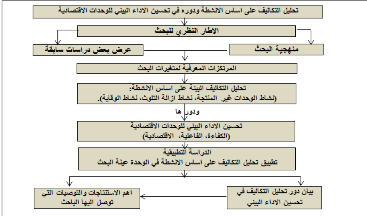
شكل (1) هيكل البحث

المتوقعة من خلال اعتماد تقنية ستراتيجية الإنتاج الأنظف مقارنة مع تقنية نهاية الأنبوب من خلال الاعتماد على الأدبيات الأولية والثانوية، وتحسين عملية الانتاج من خلال تقليل الاثار البيئية غير المرغوبة واستبدال المواد الضارة بمواد تكون صديقة للبيئية.